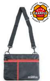
サコッシュ 【価格】2,200円(税込)

今月のオススメは「サコッシュ」! シンプルなデザインになっており、どんな服装にも合わせやすい商品です! 薄型で軽く、メッシュポケットもあるので、ちょっとしたお出かけに便利です。ぜひ、「クラブグランパス」にお越しください!