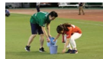
グラウンドキーパー(年齢制限無し)