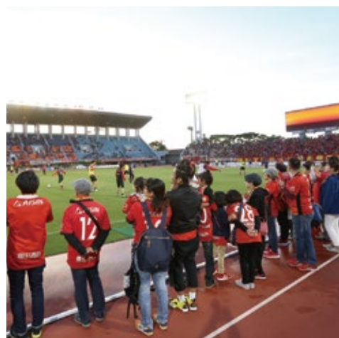
ピッチサイド見学会 (年齢制限無し)