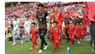
エスコート隊(小学1~3年生対象)