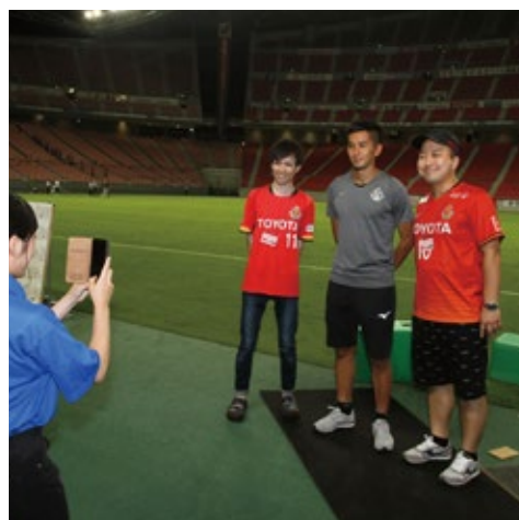
勝フォト! (年齢制限無し)