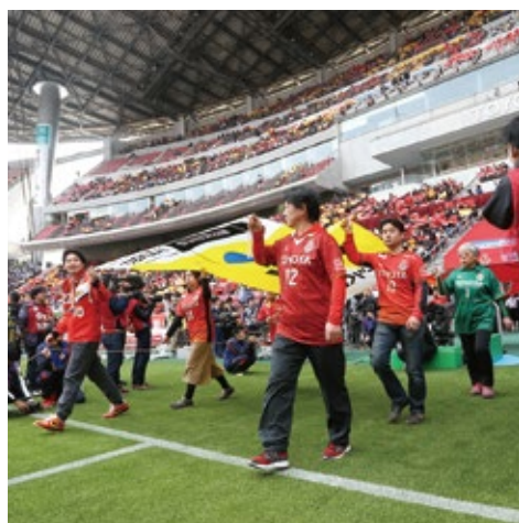
グランバスフラッグ隊 (小学4年生以上)