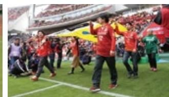
グラパスフラッグ隊(小学4年生以上)