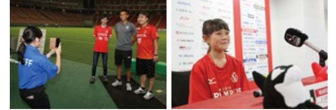
勝フォト! (年齢制限無し)