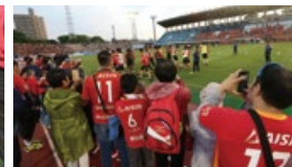
ピッチサイド見学会(年齢制限無し)