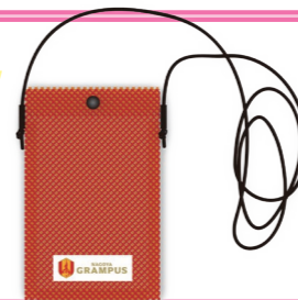
[サイズ] H190mm×W125mm 総約1280mm(結び目含む)